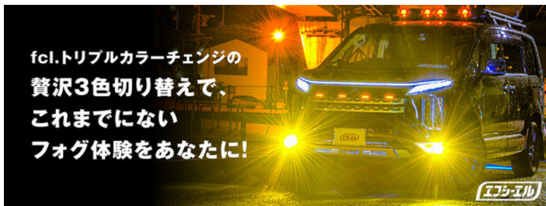
fcl.のトリチェン(R)は贅沢3色切り替え

※1「みんなカラ(みんなのカーライフ)」はLINEヤフー株式会社が運営する、同じクルマを所有しているユーザーや、趣味や価値観を共有できるユーザーが集まり、交流できる、クルマに特化したSNSです。