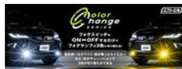
色の切り替えはかんたん！