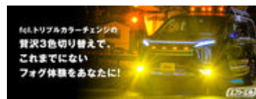
fcl.のトリチェン(R)は贅沢3色切り替え