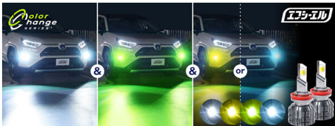
fcl.3色切り替えトリプルカラーチェンジLEDフォグランプ