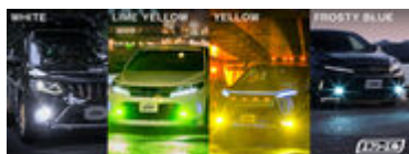
実用性と遊び心を兼ね備えたカラー展開