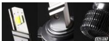
高品質な発光と耐久性を実現