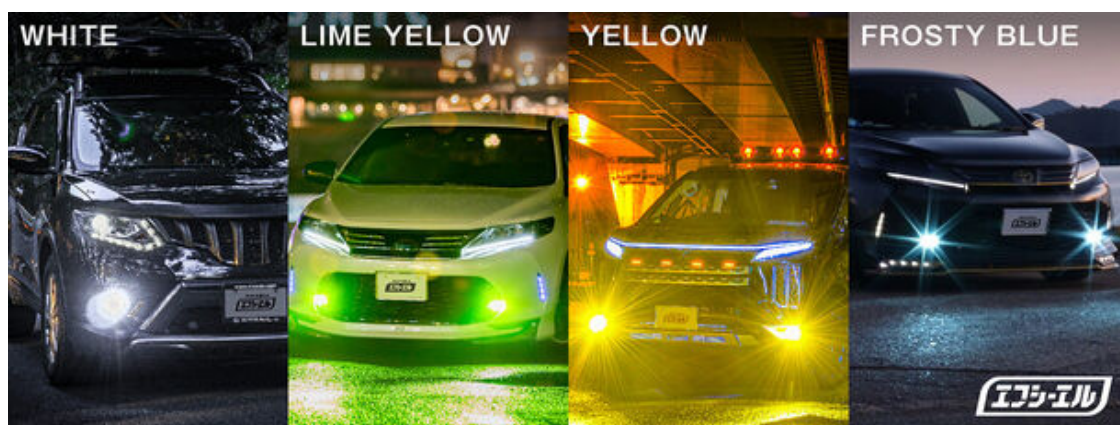
実用性と遊び心を兼ね備えたカラー展開

※3色目はファッション目的で設計しているためデイライトや写真撮影用などでお楽しみください。走行中はホワイトまたはライムイエローの使用をお勧めします。